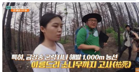
산불피해 복원 캠페인